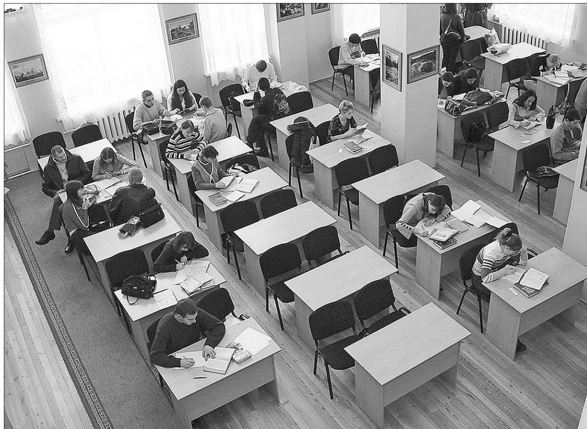
Повышение эффективности образования — одна из главных задач на будущее.

гих педагогов, врачей, среднего медицинского персонала, научных сотрудников РАН и государственных научных центров, работников учреждений культуры. При этом для врачей и научных сотрудников ориентир к 2018 году будет такой же, как для преподавателей высшей школы — 200 процентов от средней зарплаты по региону.