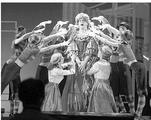
Сцена из спектакля «Тётка Чарлея».